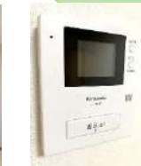
【モニター付きインターホン】