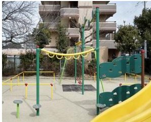
子育て世帯に大人気！公園目の前♪