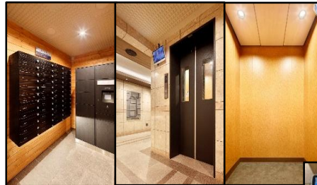
メールBOX・宅配BOX エレベーター(外) エレベーター(中)